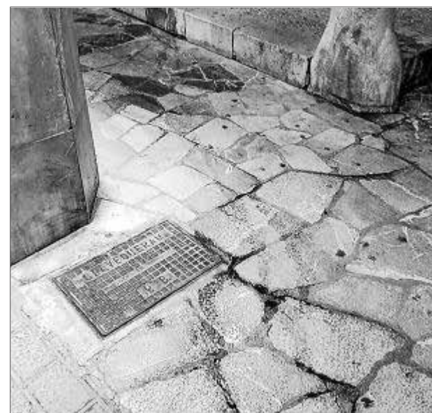
Orín en el pavimento de la calle Estret de Sant Nicolau.