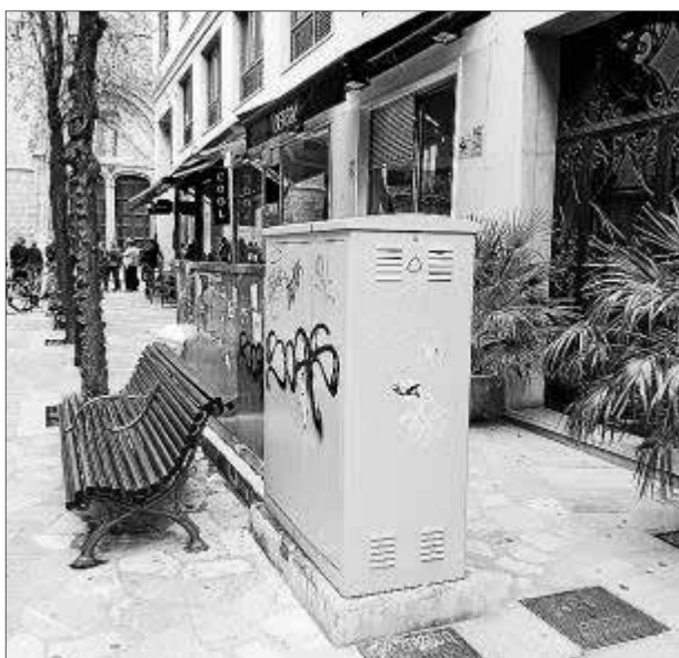
Los comerciantes piden que se quiten los armarios de Gesa.