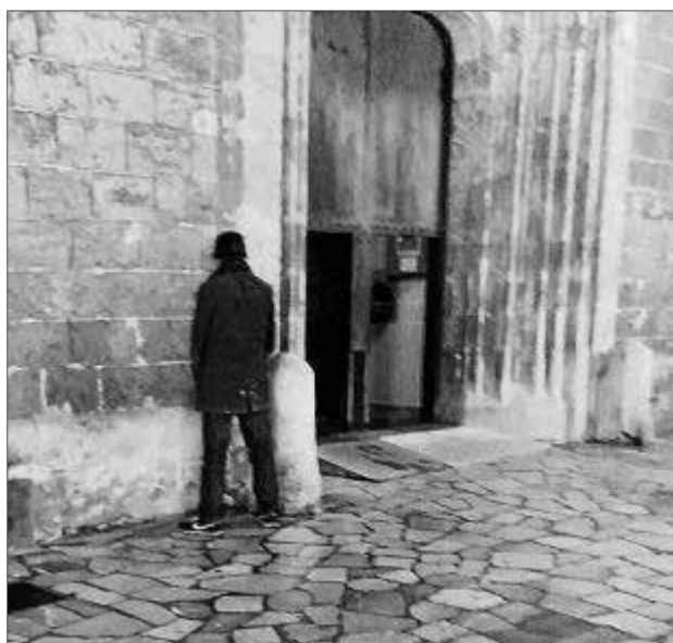
Un hombre orina en la fachada de la iglesia de Sant Nicolau.

Una representación de los Joves Arquitectes de Mallorca se reunió esta semana con el edil de Mobilitat, Joan Ferrer, al que expresaron su «preocupación» sobre temas que afectan a la movilidad de Ciutat, como el enlace de la vía conectora y los accesos al Coll o la escasa operatividad de las líneas de la EMT.