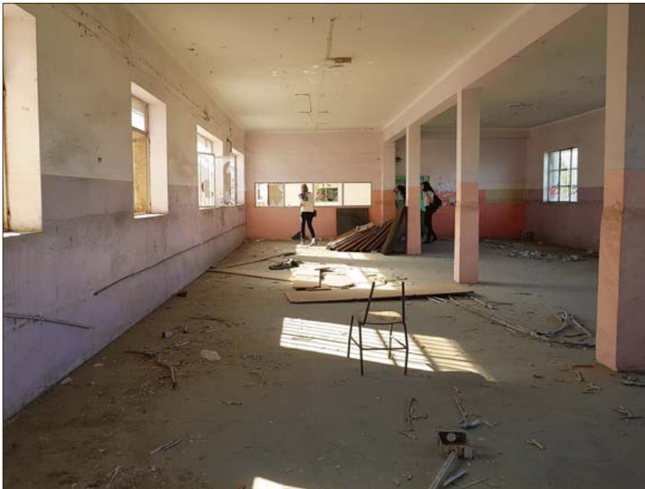
Una espaciosa sala donde se pueden desarrollar todo tipo de actividades.