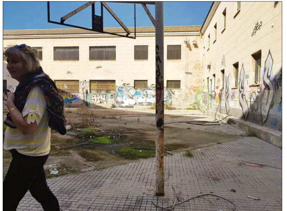
El patio del viejo recinto penitenciario, con una cancha de básquet.